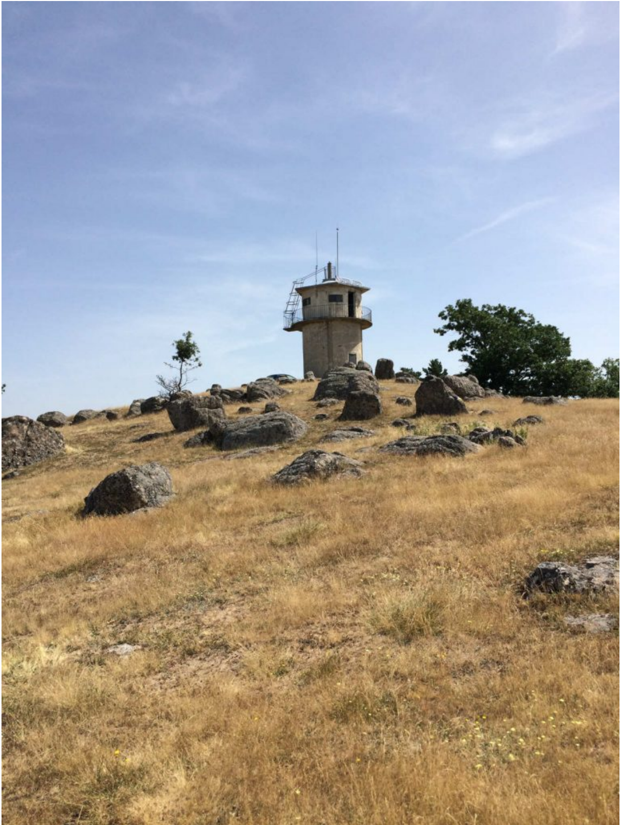
Feuerwachtürme in Canicosa de la Sierra ...