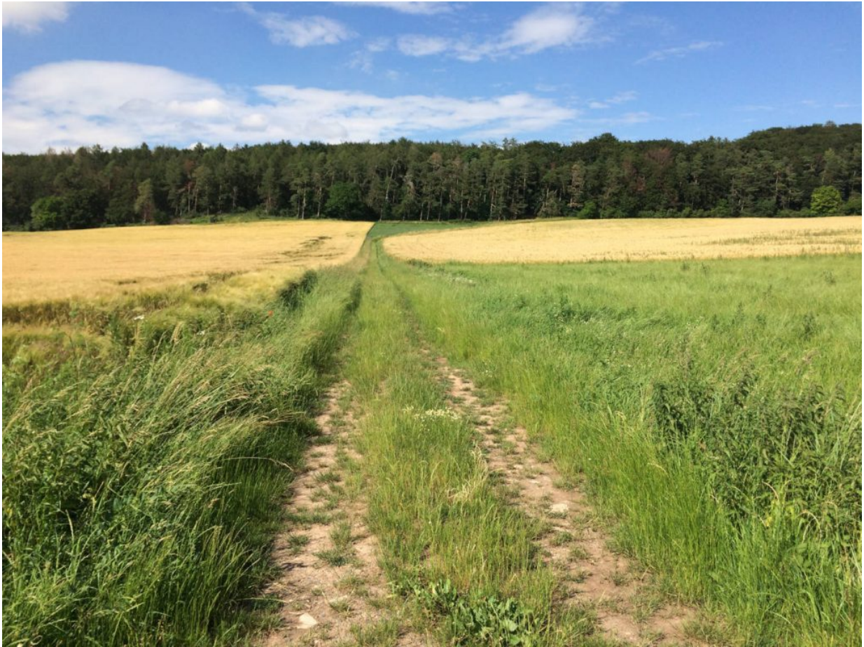
Die Anhöhe mit dem hohen Gras hinauf ...