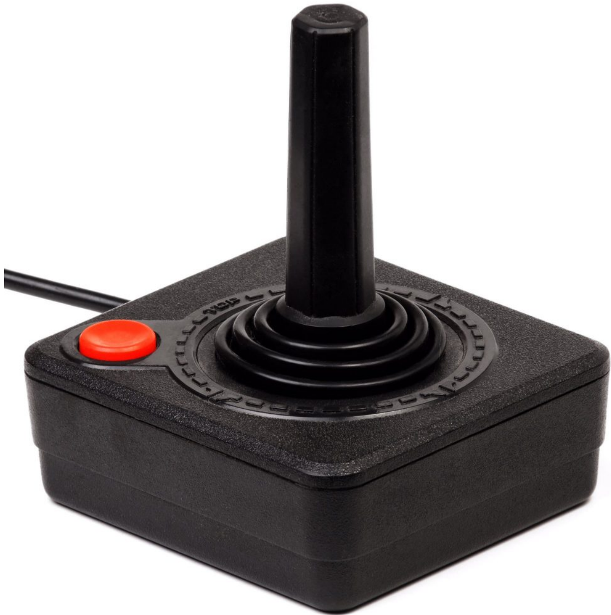
Atari 2600 Joystick

Der André schlendert ja bekanntlich gerne durch Spielwelten (wie ich auch). Besonders wenn sie so fein designt sind wie die Welt von City 17. Hier muss er sich offenbar besonders lange aufgehalten haben: