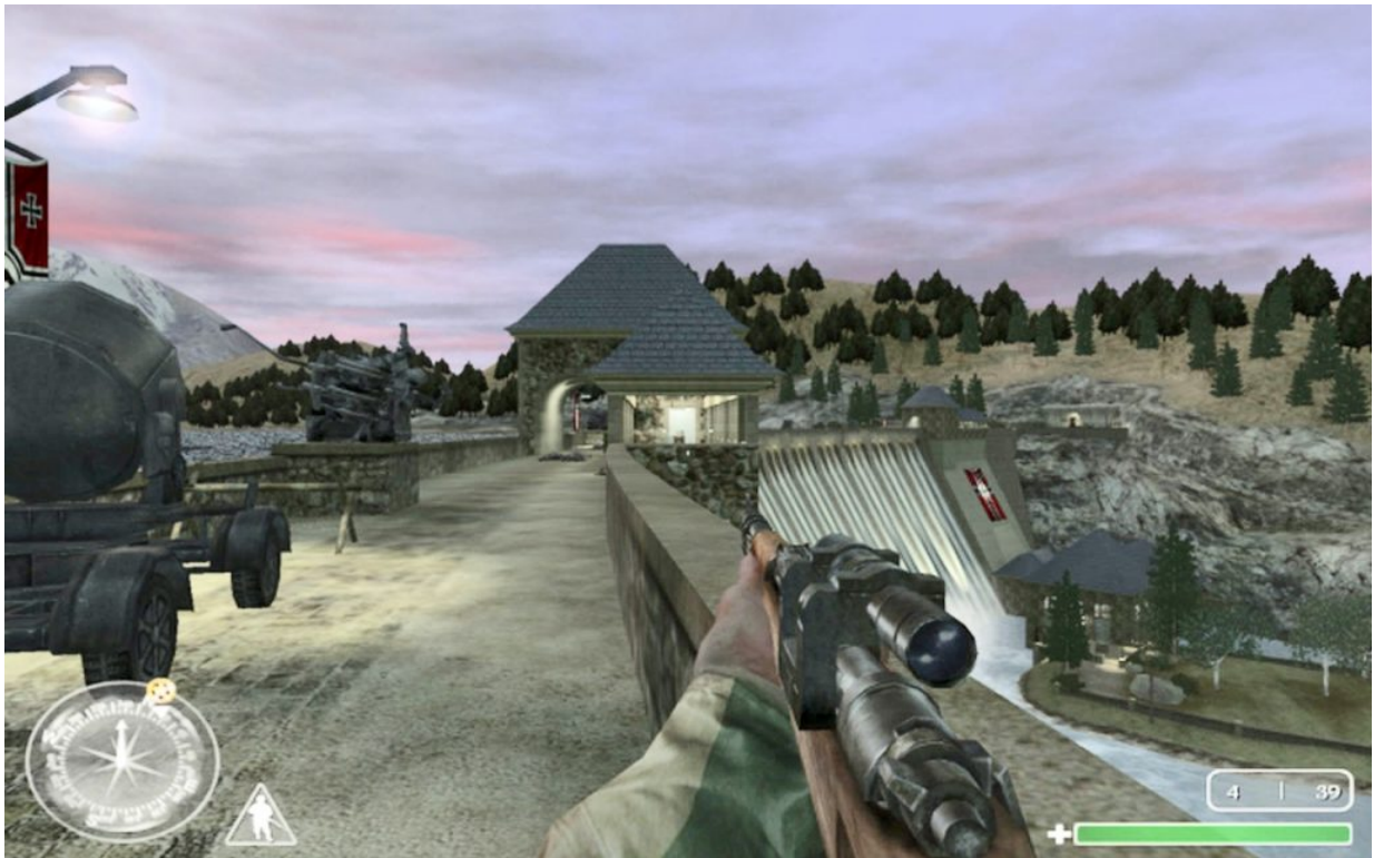
Die Edertal-Sperrmauer im Spiel Call of Duty...