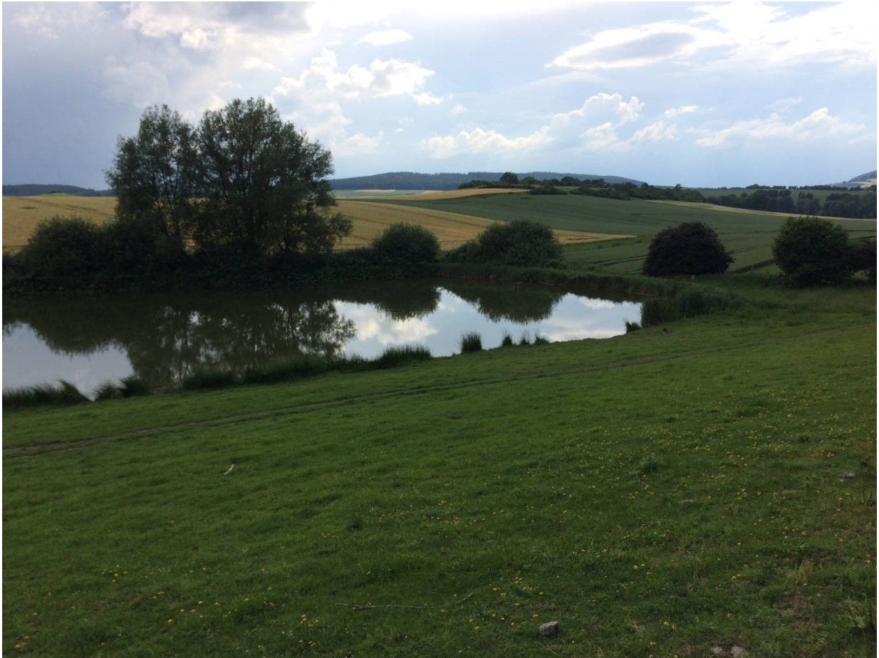
Die Fischeiche in Westufern