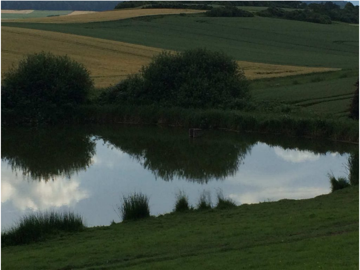
Bilder (Ferdinand Müller)