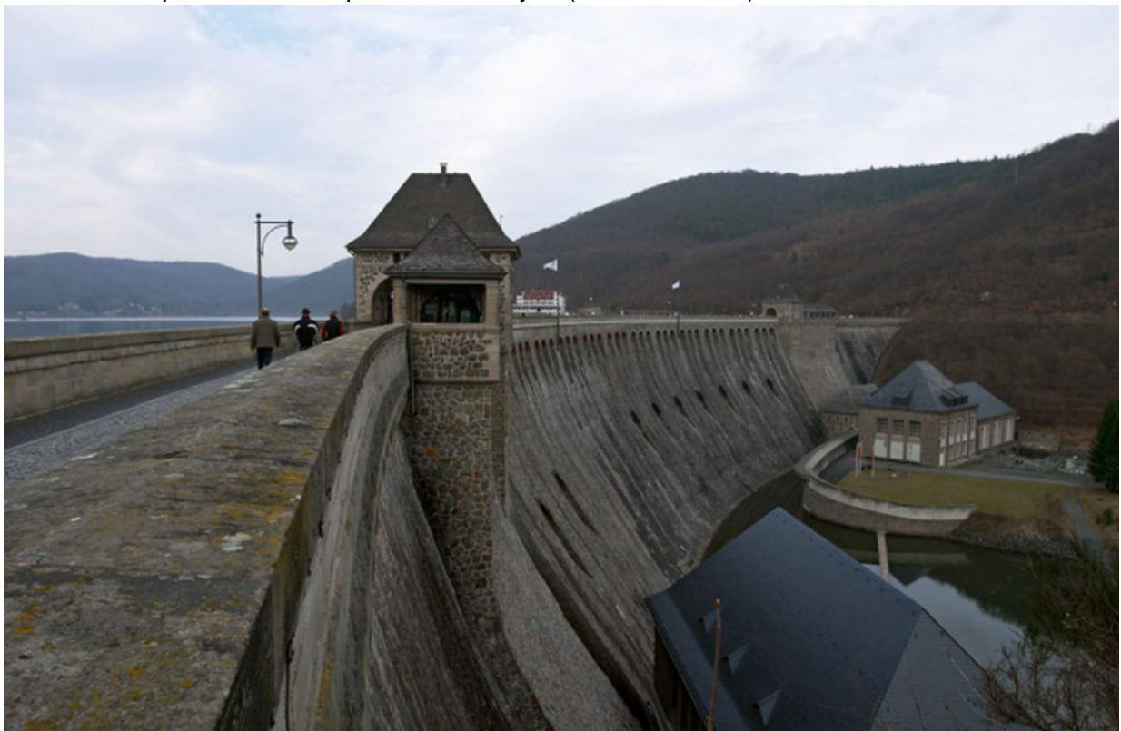
...und in der Realität. Die Ähnlichkeit ist schon verblüffend.

In heutigen Spielen kann man virtuell durch Washington, New York oder die Notre Dame spazieren und dabei kaum noch Unterschiede zur Realität erkennen. 2003 sah das noch ganz anders aus. Ich war jedenfalls sehr überrascht, als sich plötzlich vor meinem PC-Monitor die Sperrmauer auftat. In der Realität hatte ich sie schon etliche Male überquert. Aber noch nie in einem Computerspiel.