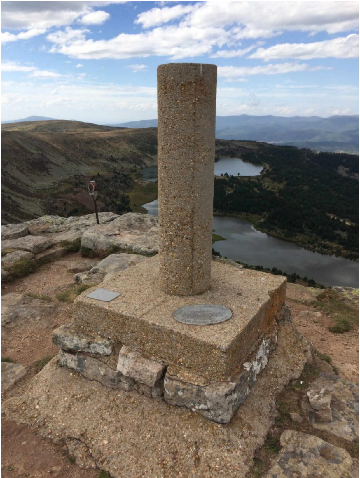
Die Lagunen von Neila, Quintanar de la Sierra