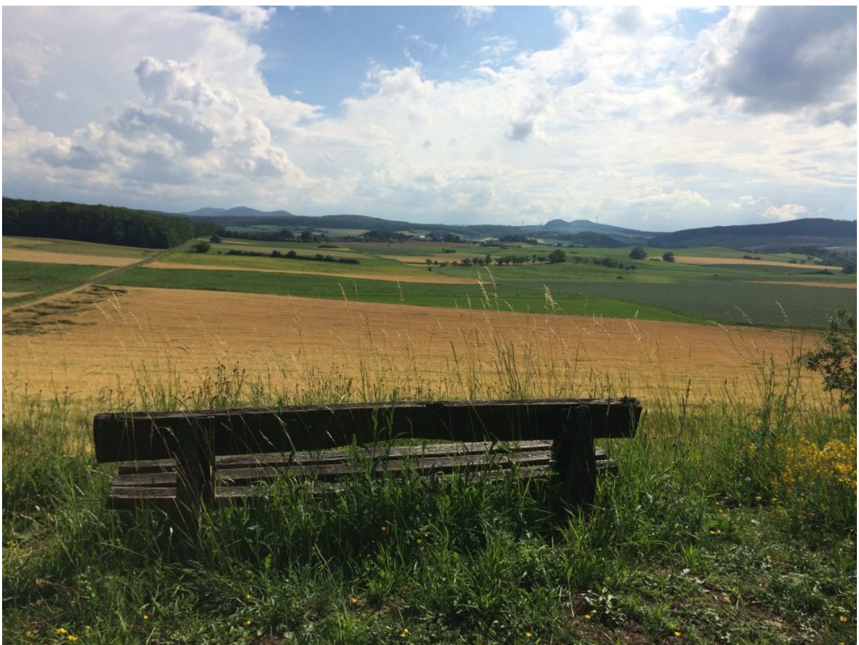
... am „schönsten Ort der Welt“ vorbei