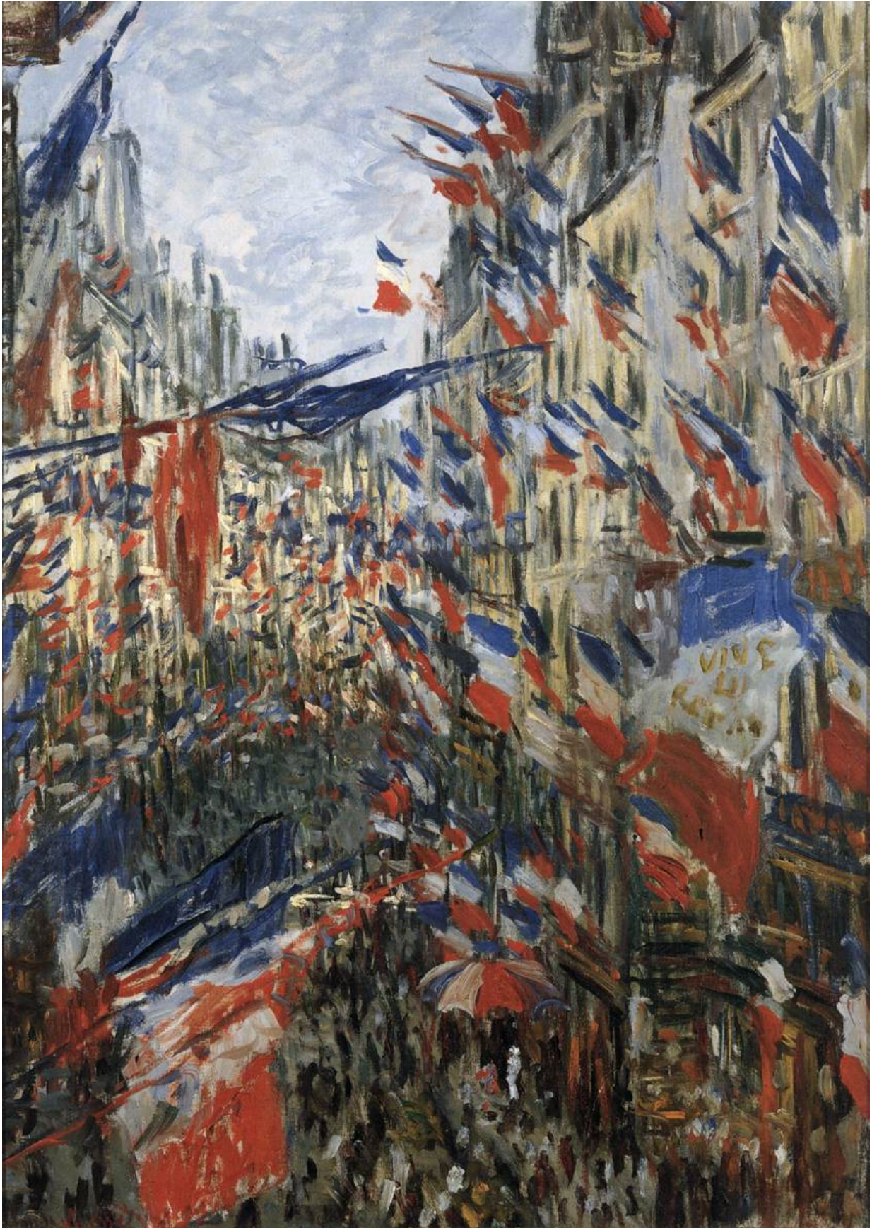
La Rue Saint-Denis, Claude Monet, 30.06.1878, Öl auf Leinwand, 76 x 52 cm

Bildlich gesprochen hatte Monet hier nur einen groben 8-Bit-Pinsel und eine 320x200-Pixel Leinwand zur Hand und nicht mal 8 Farben zur Auswahl. Viel Zeit für Details kann Monet ohnehin nicht gehabt haben; die Karawane zog schließlich zügig weiter und ewig