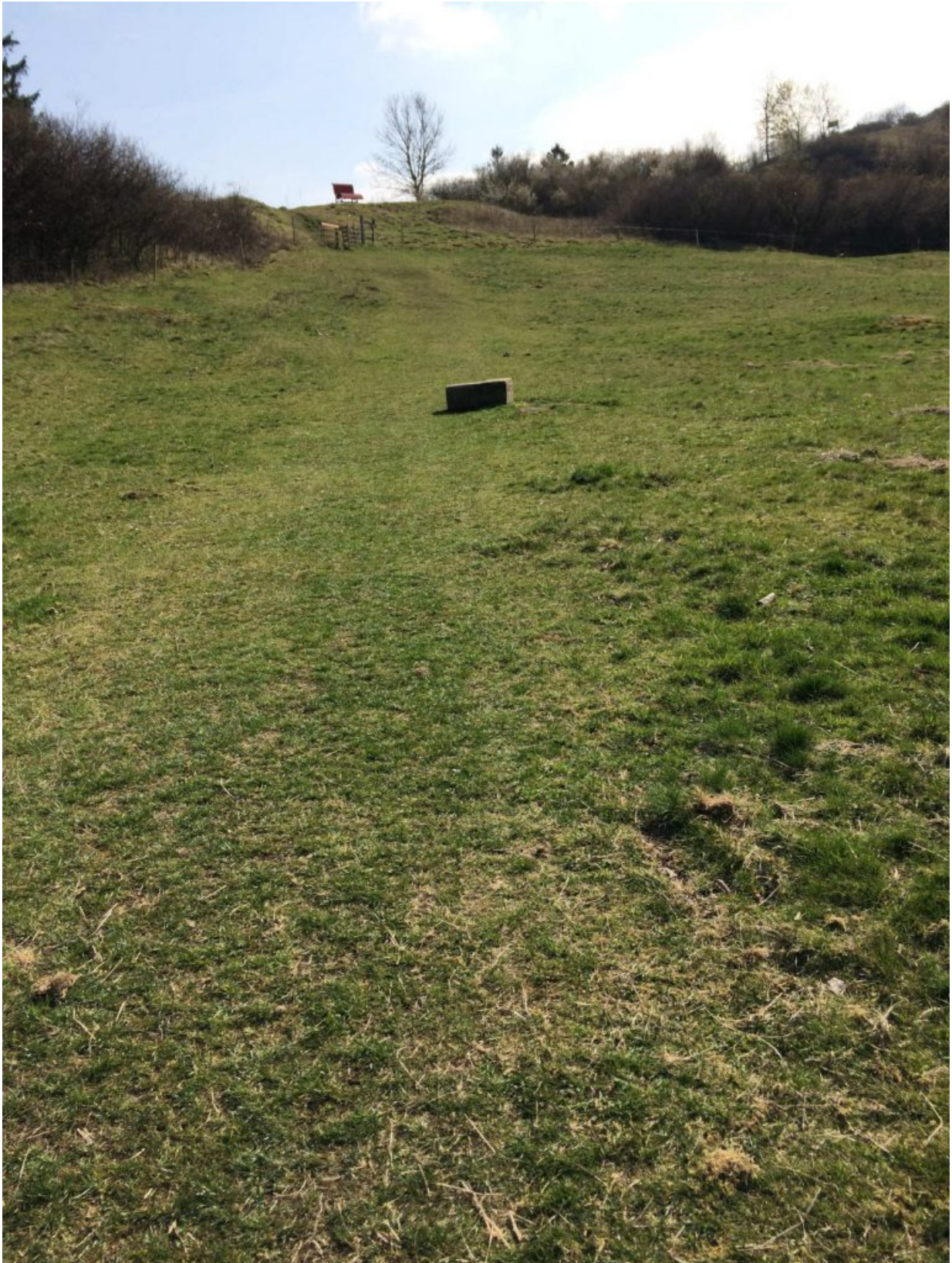
Bilder: Ferdinand Müller