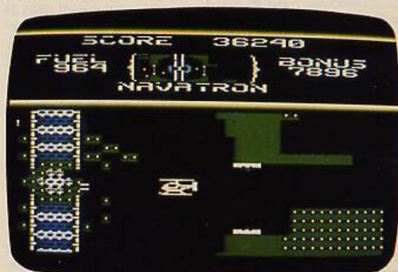
Bild 2. Um die Geiseln zu befreien, muß man öfter den Weg durch Gemäuer freischießen

Spielprofil zu Fort Apocalypse von Synapse-Software für den Commodore 64.