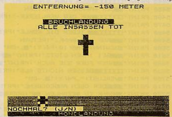
Bild 2. Diese Fähre landete mit zu hoher Sinkgeschwindigkeit