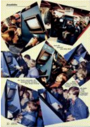
Die Spielkids von 1984 bei Videomagic.

Bei den Kindern und Jugendlichen, die sich für Video- und Computerspiele interessieren, hat sich allerdings, im positiven Sinn, nur wenig getan. Die Begeisterung am Spielen ist erfreulich konstant geblieben. Die Fotos von damals sind mit den Fotos von heutigen Jugendlichen nahezu austauschbar. Aufgenommen wurden sie übrigens im seinerzeit sehr beliebten Münchener Videospiele-Fachgeschäft Videomagic , das sich in unmittelbarer Nähe des Stachus befand.