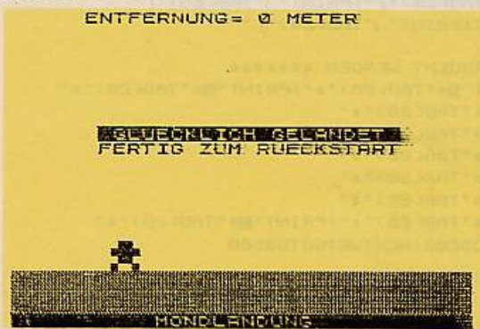
Bild 3. nach geglückter Landung beginnt der Countdown für die Rückkehr