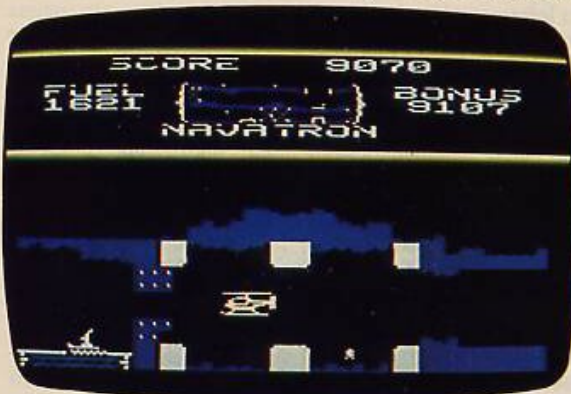
Bild 1. Fort Apocalypse: Mit dem Hubschrauber Menschen aus einem Höhlensystem befreien

Pharao's Curse. Dieses Spiel hebt sich wohlthuend durch seine Originalität von der Masse der Computerspiele ab.