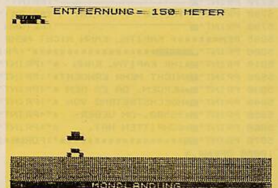
Bild 4. Jetzt heißt es das Mutterschiff genau anzupeilen und anzukoppeln