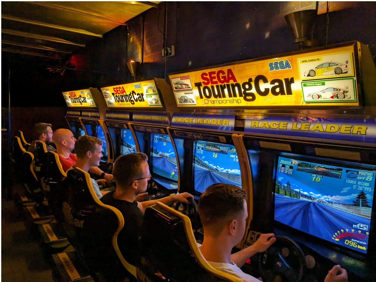
Sega Touring Car – Gegeneinander macht es auf der Piste gleich noch mehr Spaß