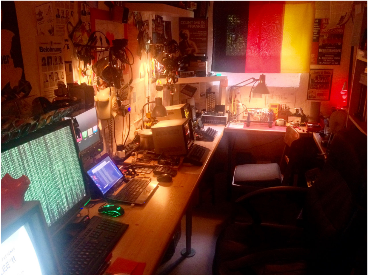
Mein Hobbykeller-Paradies. Voll, aber dafür eng.

Der ZX81 ist eine wunderbare Maschine. Gebaut für die Massen wurden davon etwa 1,5 Millionen Einheiten verkauft. Der kleine Türstopper, wie er von seiner Fangemeinde zärtlich genannt wird, besteht aus fünf ICs, welche den Rechner klein und – noch wichtiger – verständlich machen. Für mich ist er der Prototyp eines idealen „Hackingdevice“.