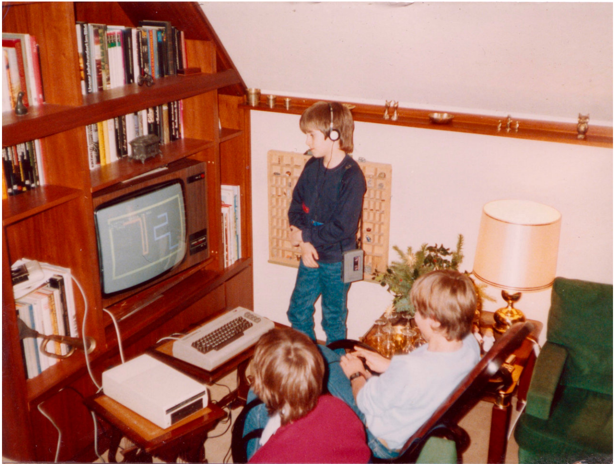
Die 80er: man beachte den Walkman meines Bruders...