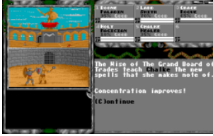
Das Rollenspiel Legend of Faerghail. (Bild: Rainbow Arts, 1990, Amiga)

Hmmmh... der Titel ist mir bekannt und auch das Titelbild kenne ich noch gut. Ich kann mich allerdings nicht daran erinnern, das Spiel selbst je gespielt zu haben. Auch die Screenshots die ich mir eben ansehe bringen absolut keine Erinnerungen auf. Insofern kann ich, glaube ich, ganz definitiv sagen, dass LoF keinen Einfluss auf uns hatte. Was Features für Spirit of Adventure angeht hatte StarByte keinen Input. Die waren Spezialisten darin Features zu streichen, aber nicht darin, Spiele gut zu machen. Ganz davon abgesehen, kam StarByte relativ spät ins Gespräch, da unsere ursprünglichen Pläne waren, das Spiel selbst zu publishen.