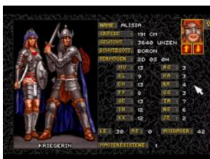
Ich bin immer noch total in die Grafiken der Helden-Generierung verliebt. Das Schwarze Auge: Die Schicksalsklinge von 1992.