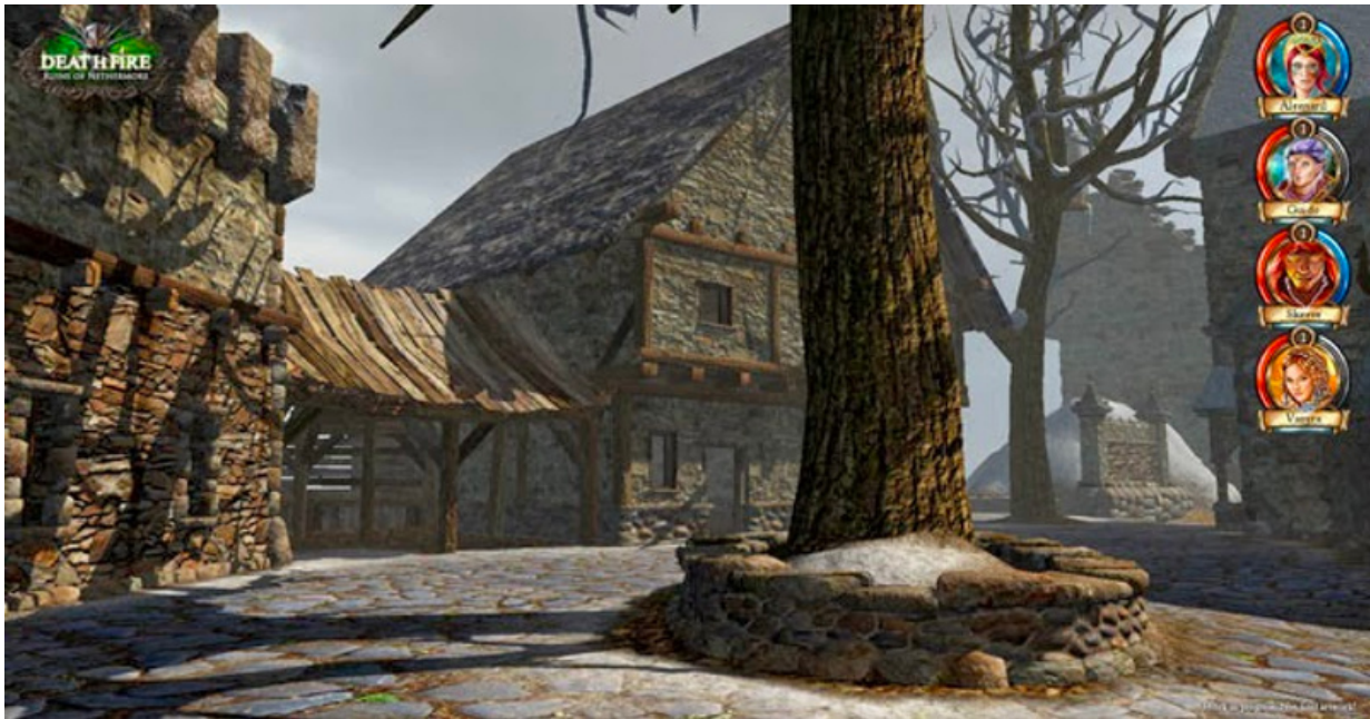
Ein Screenshot von Deathfire: Ruins of Nethermore.

wir hatten ursprünglich sehr große Pläne damit.