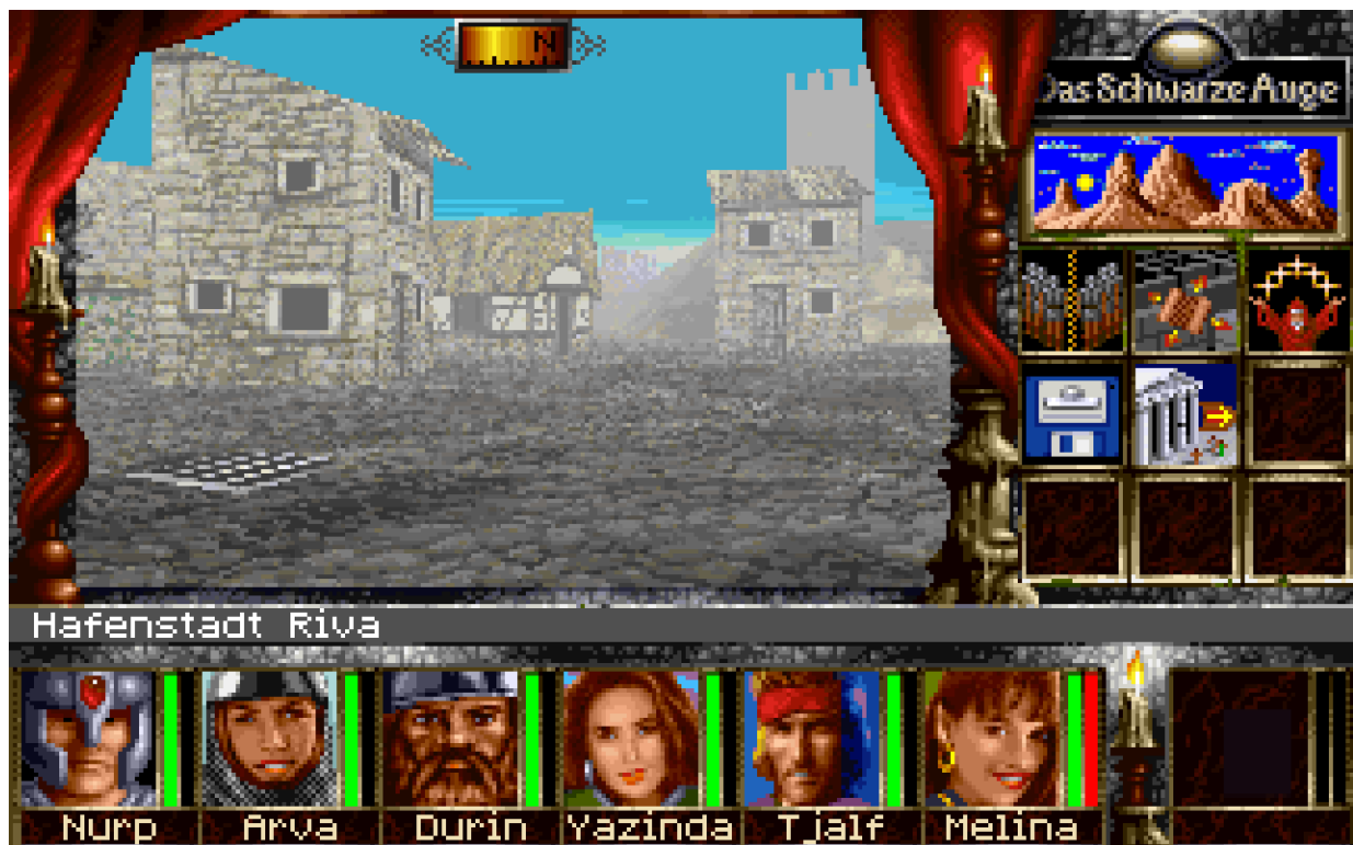
Das Schwarze Auge: Schatten über Riva.

Nein, jedenfalls nicht von meiner Seite. Ich muss allerdings gestehen, dass ich absolut kein Wettbewerber bin. Dieses Denken, dass ich besser sein muss als Andere kenne ich überhaupt nicht. Ich habe einfach kein Konkurrenzdenken. Das ist was für Sport, ist aber in unserer Branche total fehl am Platz. Der Markt ist immer groß genug gewesen um jeden Entwickler zu unterstützen. Wenn jemand Spiel A mag und kauft, bedeutet das überhaupt nicht, dass er deswegen Spiel B nicht kauft. Die Konkurrenz-Logik machte für mich noch nie Sinn und das ist auch der Grund, warum ich immer gerne bereit bin anderen Leuten zu helfen, wenn ich kann. Damals wie heute. Im Gegenteil, ich bin immer endlos fasziniert von Leuten die besser sind als ich und versuche dann von denen zu lernen.