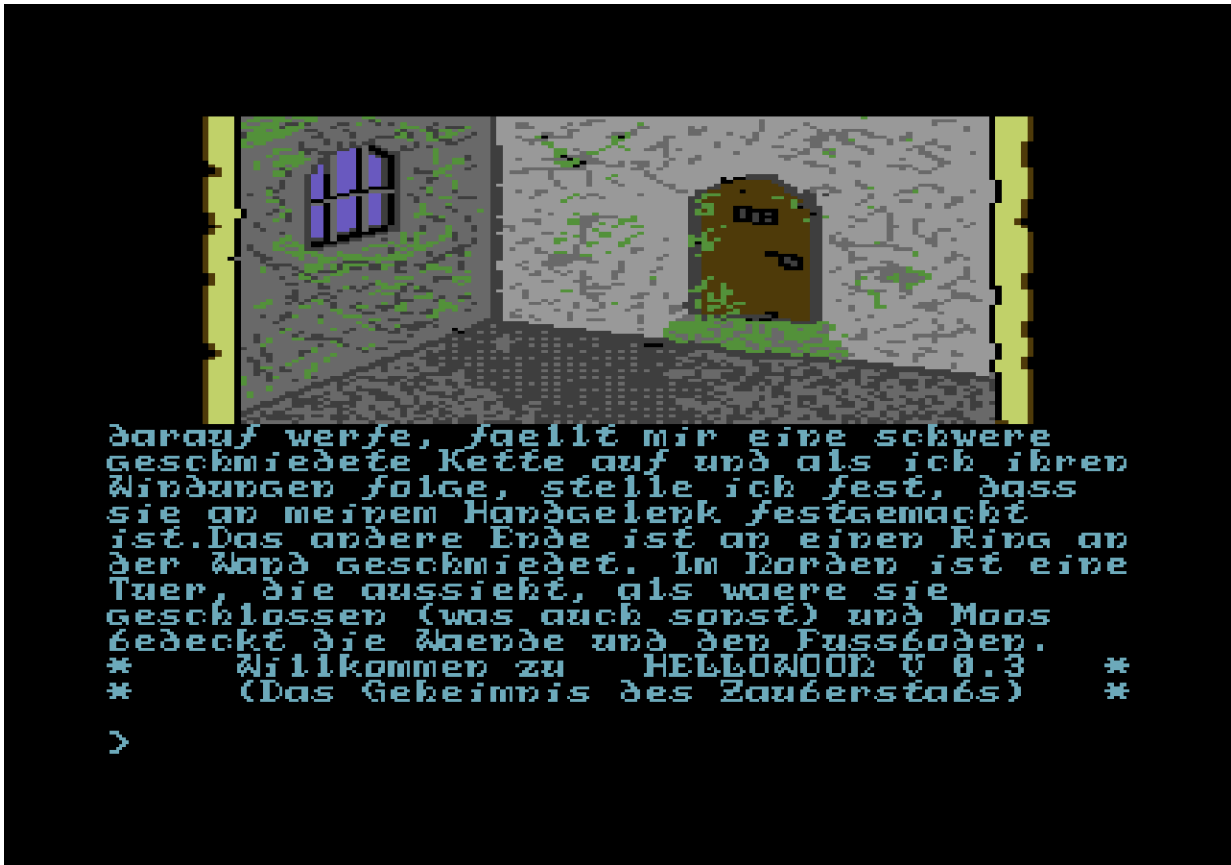
Hellowoon: Das Geheimnis des Zauberstabs, Screenshot vom Commdore 64.

Entwickler, Rollenspieler, Visionäre treffen sich und pflegen, statt einer Konkurrenz, einen freundschaftlich interessierten, herzlichen Austausch. Gab es zu einem Zeitpunkt die Überlegung einer Zusammenarbeit, stellte man sich gar Routinen, Engines, Soundtracks, Demos usw. vor?