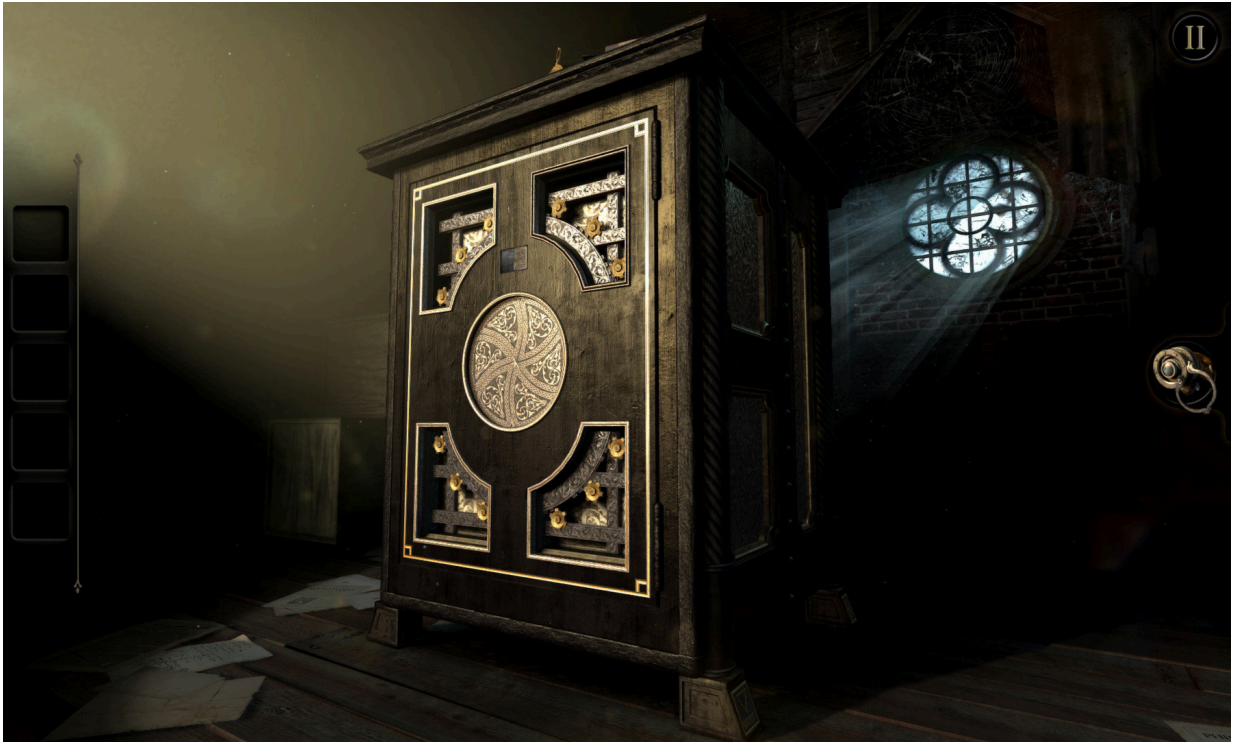
Eine Kiste – Unendliche Möglichkeiten