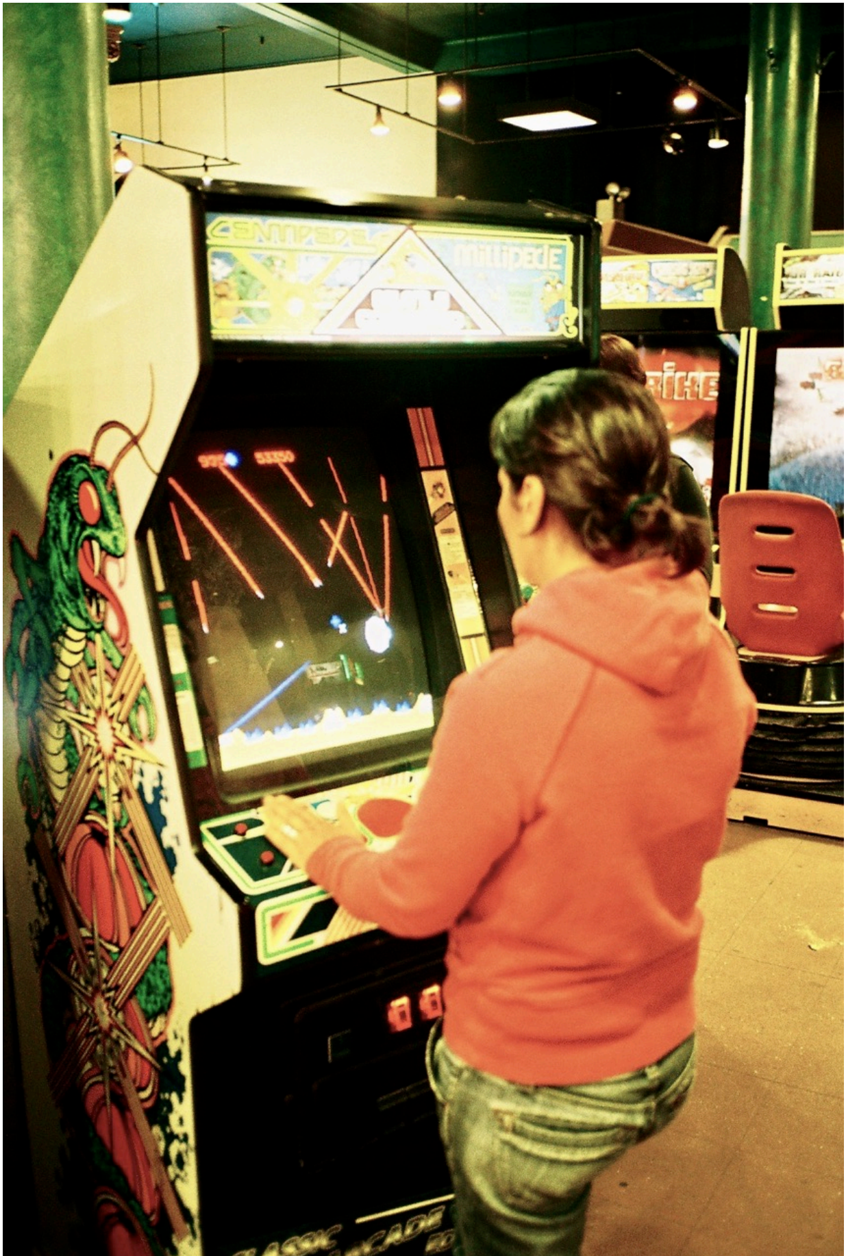
Missile Command von 1980 ist mit seinem Trackball-Controller auch heute noch eine echte Herausforderung.