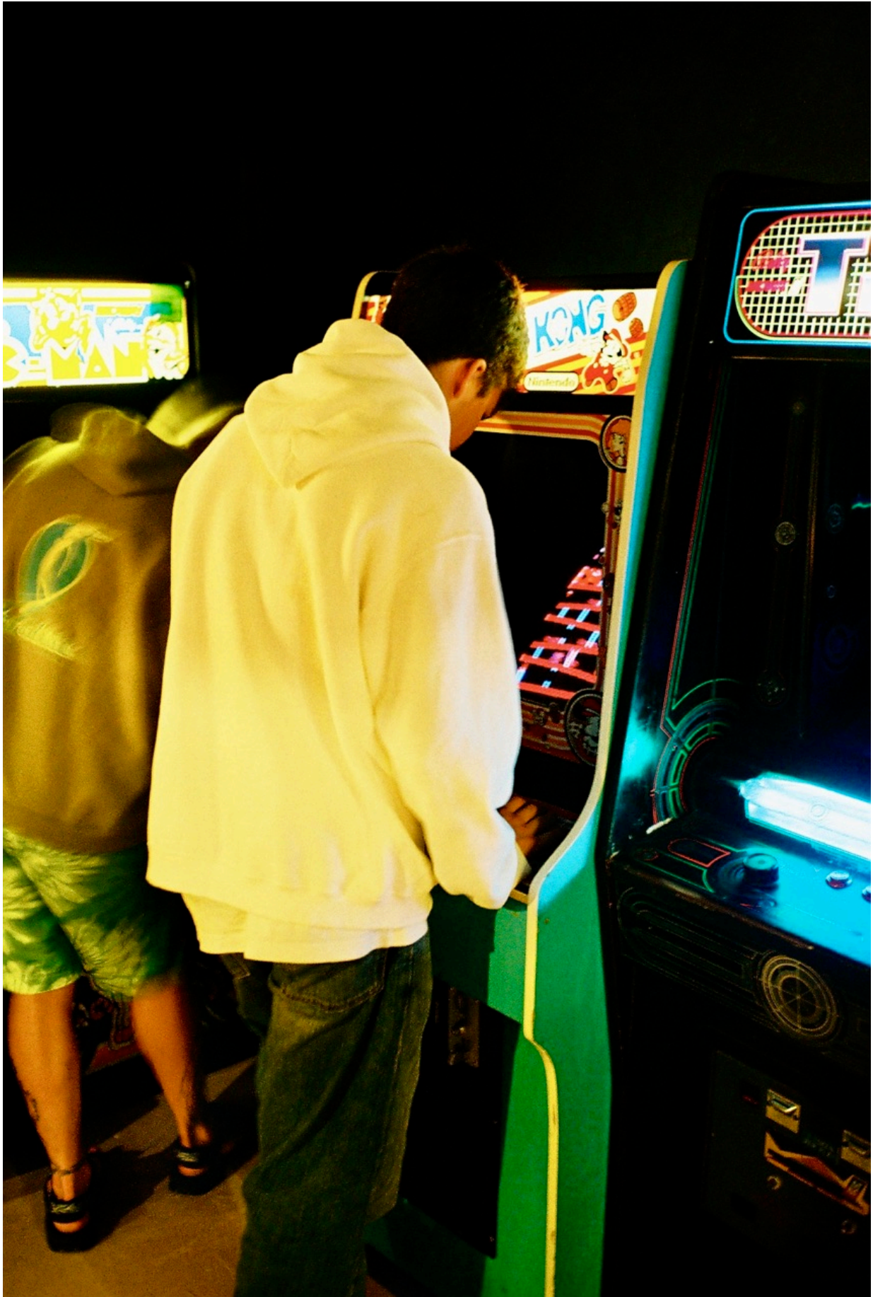
Donkey Kong und rechts daneben der einmalig schöne TRON-Automat.