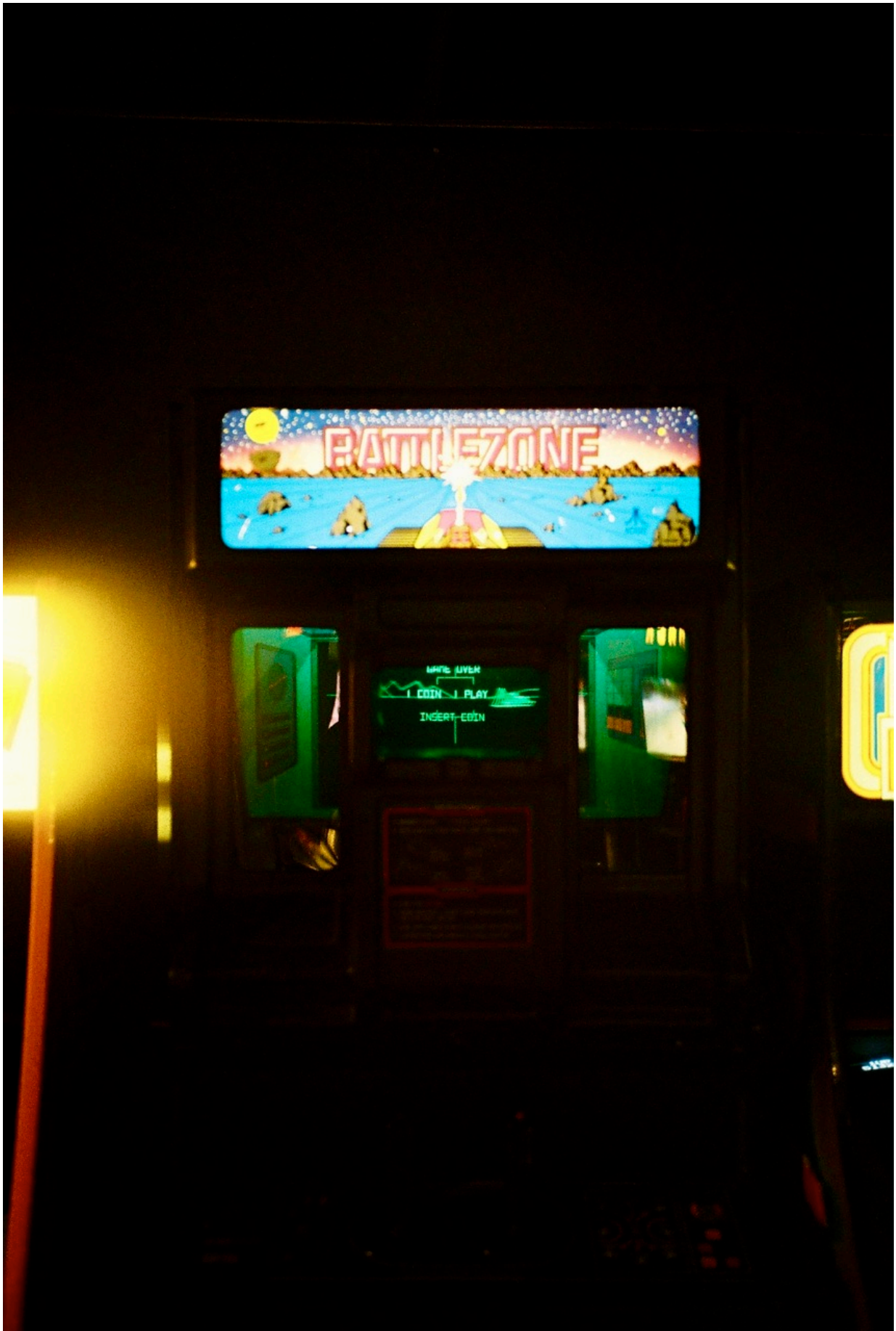
In Battlezone von 1980 steuert man seinen Panzer in einer Vektor-Welt!