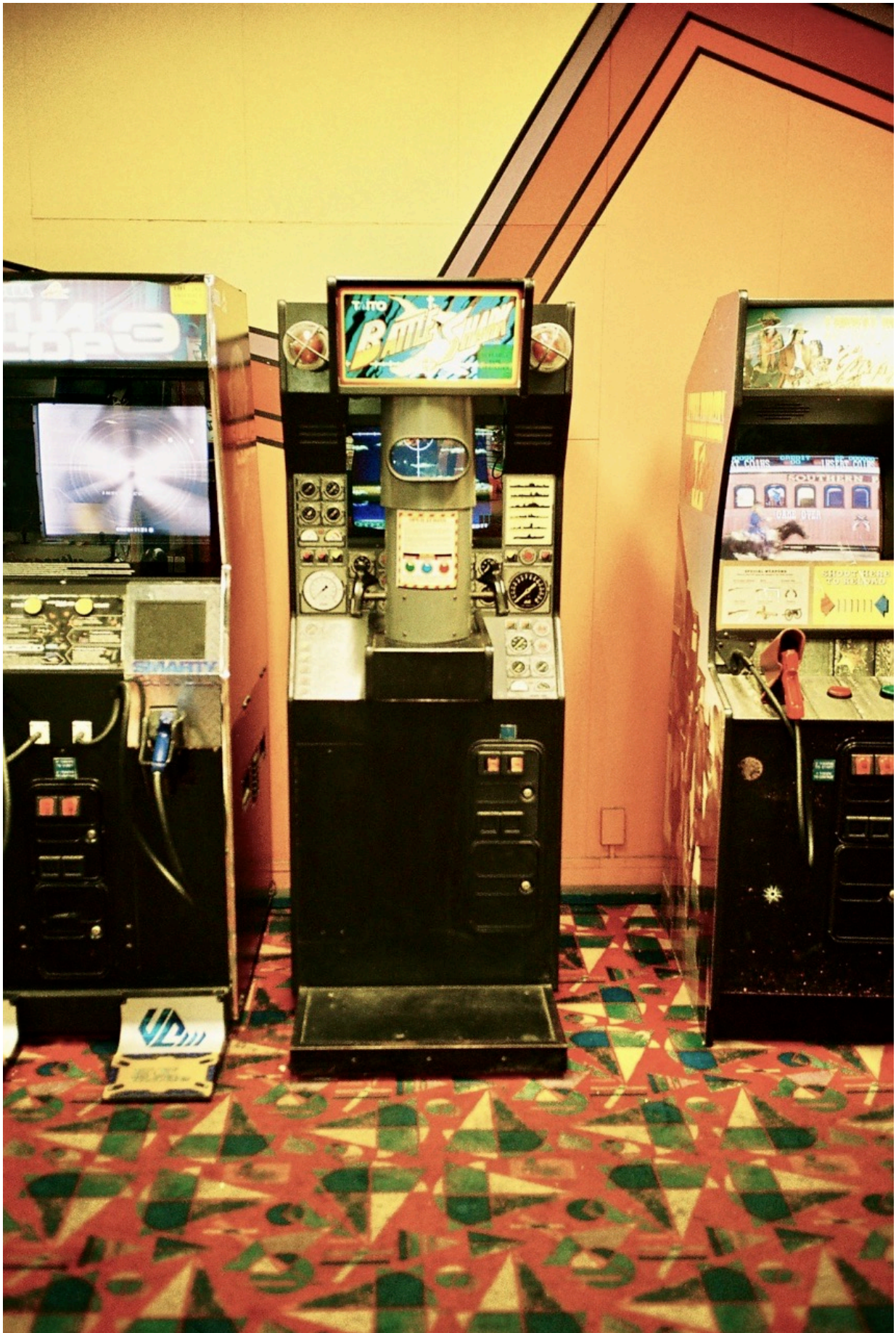
Taito's Battle Shark von 1989 ist eine U-Boot-Simulation.