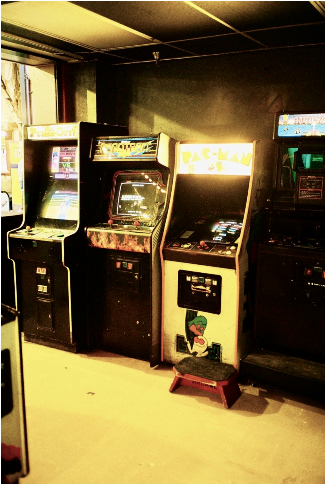
Robotron: 2084, Pac Man und Battlezone kommen direkt aus den 1980ern.