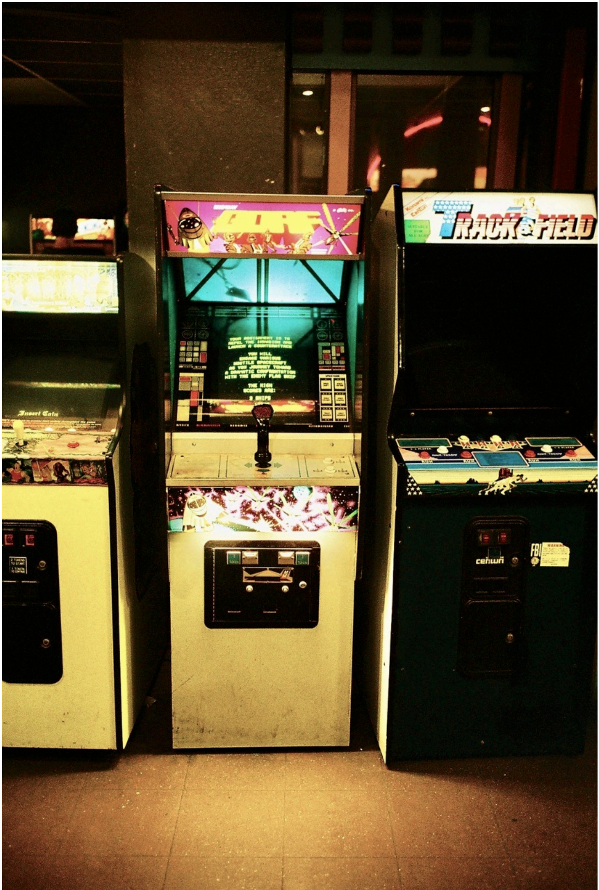
Gorf und Track & Field zwei Legenden aus der „Golden age of arcade video games“.