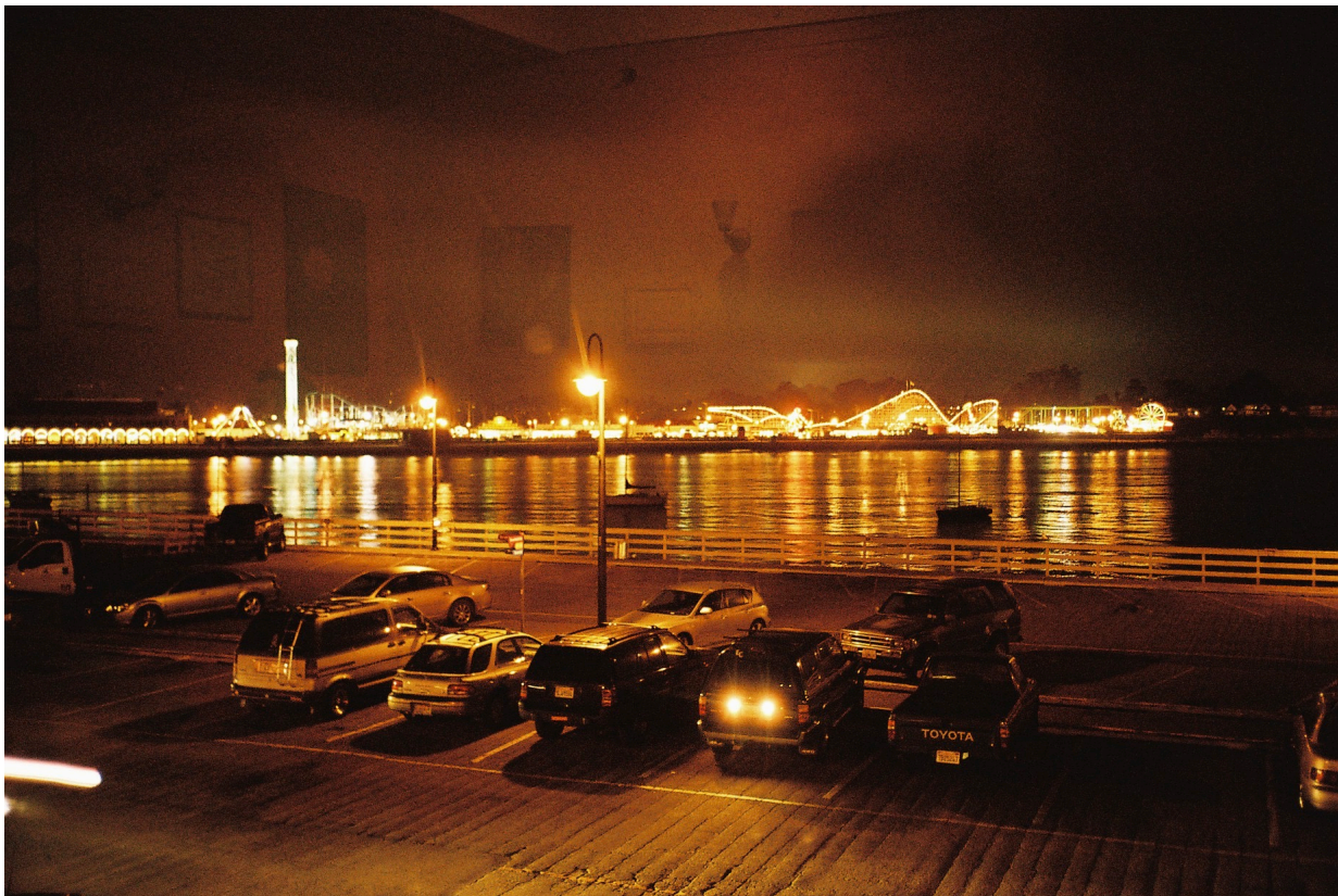
Ein Blick vom Pier-Restaurant auf den Beach Boardwalk.

Der Abend wurde dann auf dem Pier der Municipal Wharf bei einem Abendessen abgeschlossen. Hier konnte ich einen letzten wehmütigen Blick auf den Beach Boardwalk werfen, dessen Pforten sich langsam schlossen.