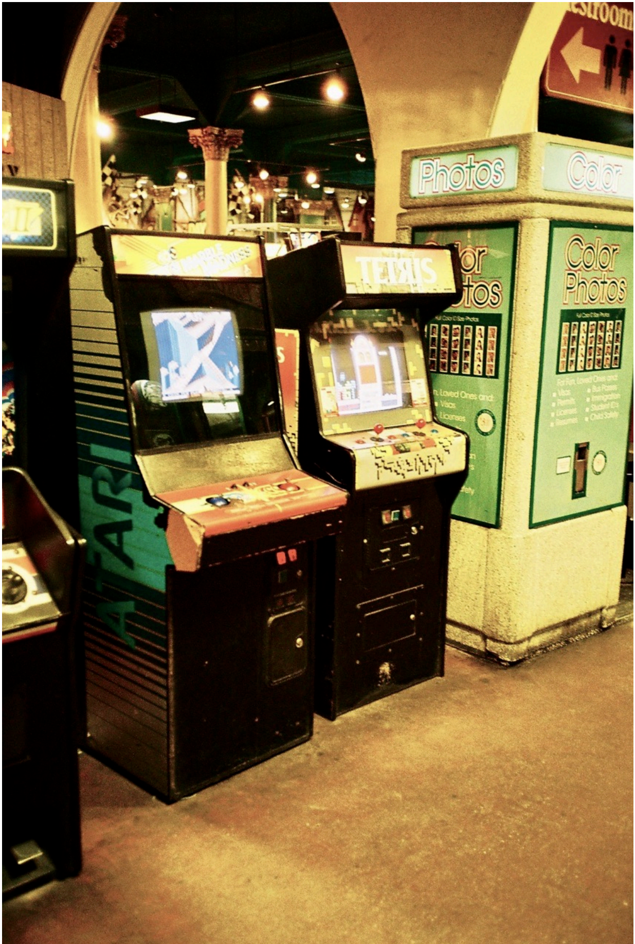
Sogar einen Original Tetris-Automat bietet die Arcade.