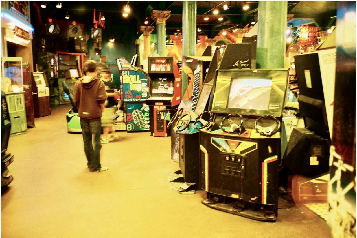
Ein Rennen zu dritt? Kein Problem! Für jeden Geschmack findet sich ein Automat.