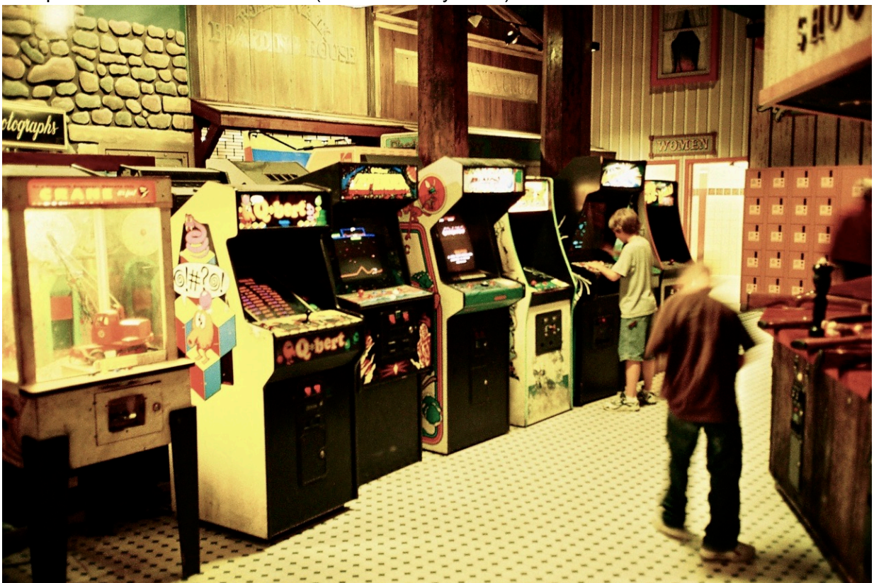
Q*Bert, Defender und viele weitere Arcade-Automaten stehen zum Spiel bereit.