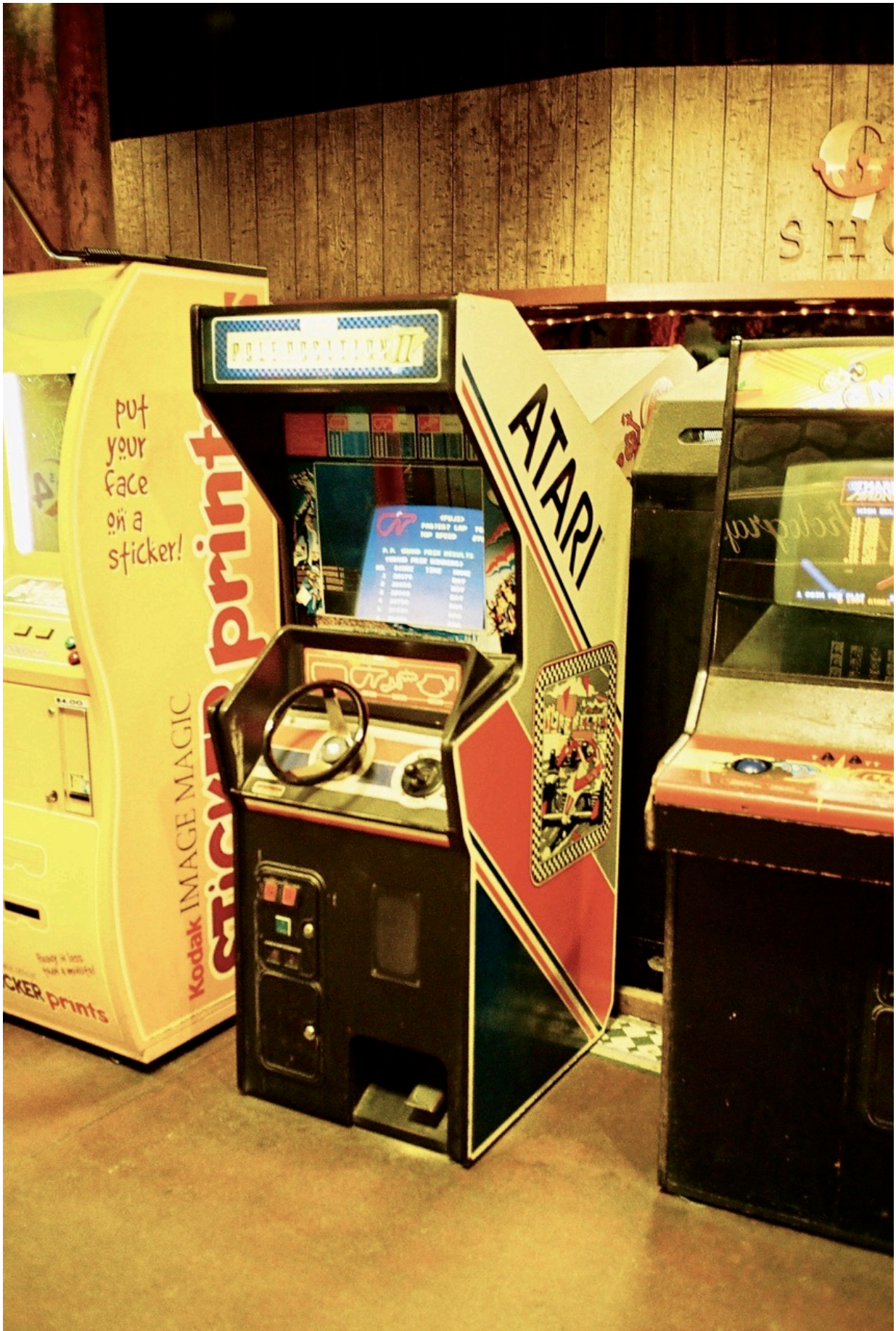
Pole Position II von Atari mit Lenkrad und Gaspedal.