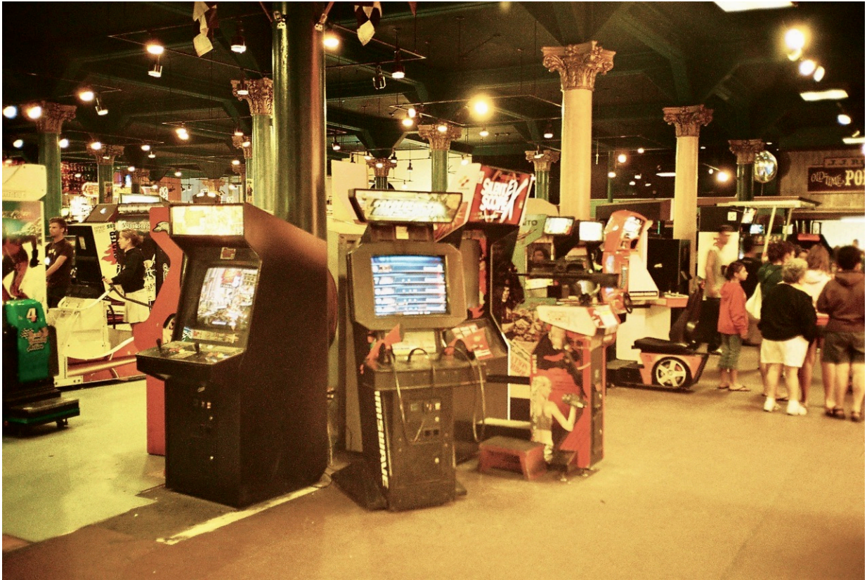
Spielautomaten so weit das Auge reicht. Die mit Säulen verzierte Arcade ist der perfekte Ort für Spielmaschinen aller Couleur.