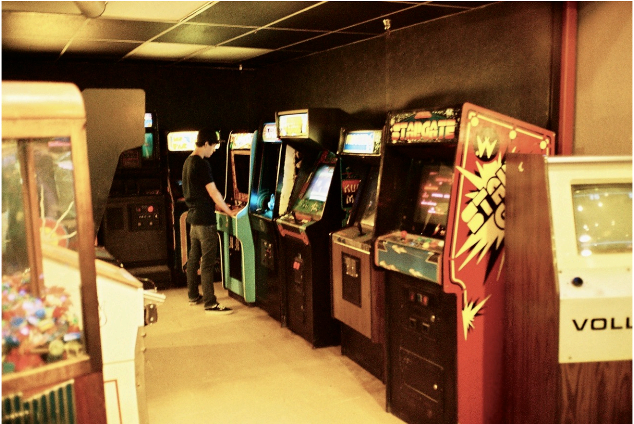
Volley, Stargate, Kung Fu Master – nahezu alle Klassiker sind vertreten.