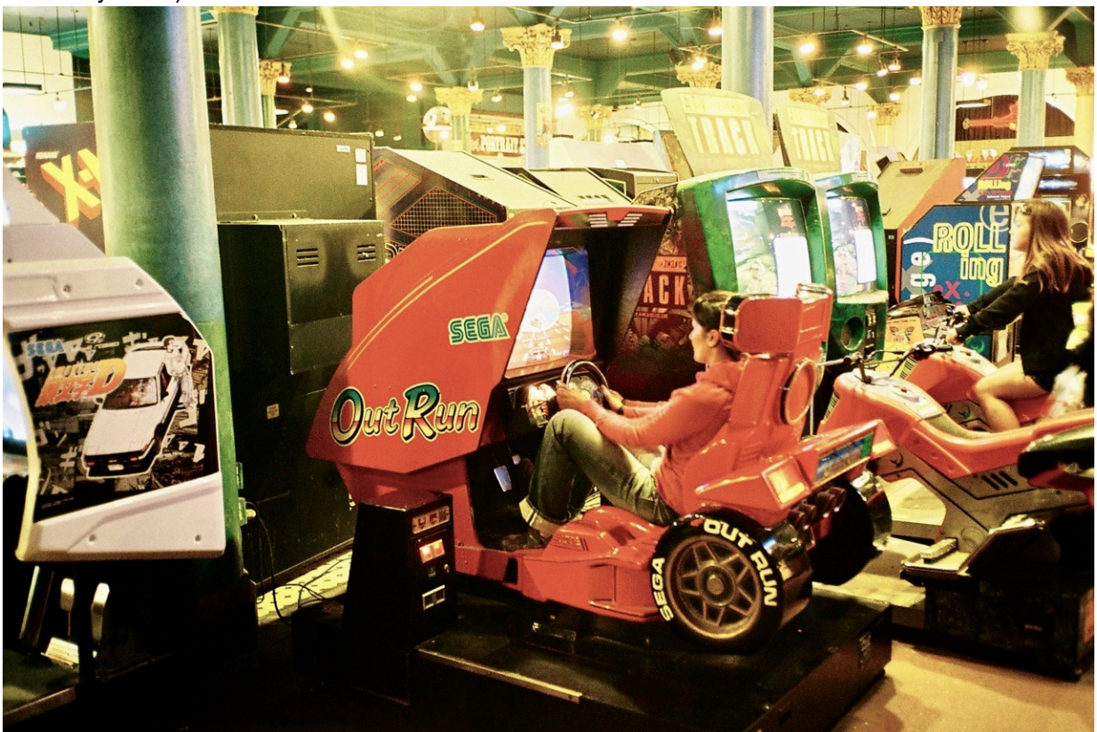
Ein Out Run Sit-In von SEGA. Natürlich im klassischen rot.