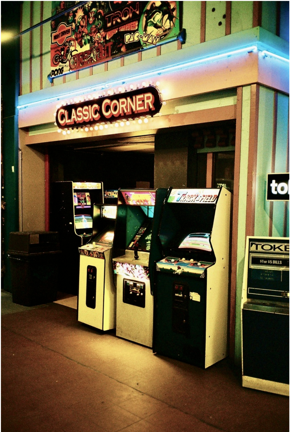
Die „Classic Corner“ lädt zum Spielen ein...