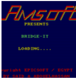
Die Ladebildschirm von Bridge-It.

Selbst wenn es nicht auf dem bei Amsoft obligatorischen Titelscreen stehen würde, könnte man dieses Programm sofort als Produkt aus dem Hause Epic (nicht zu verwechseln mit der Spieleschmiede, die Spiele wie die Unreal-Serie hervorgebracht hat) erkennen.